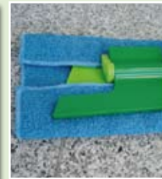
Für Treppenreinigung können Tücher zusätzlich festgemacht werden.