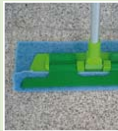
Tuch läuft immer nach.