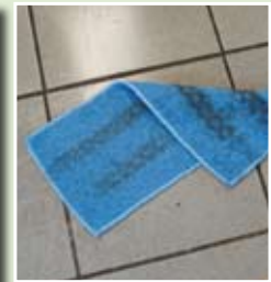
Angebotene Tücher teilweise beidseitig verwendbar.