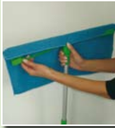
Aufsetzen des Tuches auf den Wischer.