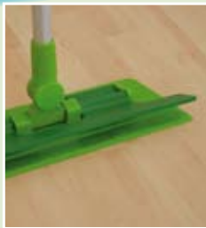
Kraftvoller Magnetverschluß für Fußbedienung.

die Alternative zum klassischen Flachmopp mit der großen, grünen Klappe