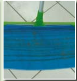
Reinigungsergebnisse müssen sich als klare Linien (Schmutz) zeigen.