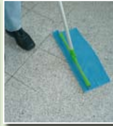
Verstellen des Wischers auf dem Tuch, nach einigen Quadratmetern.