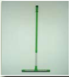
Wischer für ca. 10fach höheren Anpressdruck.

das geniale, einfache, innovative Wischsystem mit den grünen Clipsen